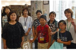
南下コース参加の皆様

真庭市図書館では、8月18日、南からの北上コース、19日、北からの南下コースのスタンプラリーバスを運行しました。ご参加された皆様、ありがとうございました。今回参加のお客様で、見事に全館制覇された方も。