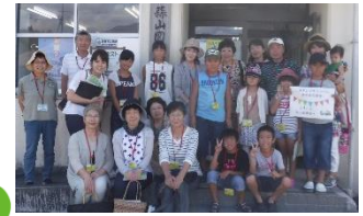
北上コース参加の皆様

真庭市図書館では、8月18日、南からの北上コース、19日、北からの南下コースのスタンプラリーバスを運行しました。ご参加された皆様、ありがとうございました。今回参加のお客様で、見事に全館制覇された方も。